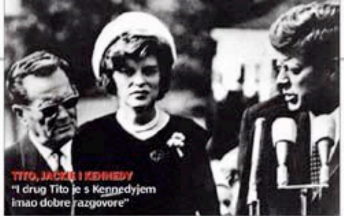
TITO, JACKIE I KENNEDY "I drug Tito je s Kennedyjem imao dobre razgovore"

Vladimir Bakarić je na sjednici Predsjedništva SFRJ iznio i svoj alternativni plan vezan za otmicu zrakoplova TWA, za slučaj da se taj zrakoplov spustio na zagrebački aerodrom Pleso (što se, kao što je poznato, nije dogodilo, jer su se otmicari predali još u Parizu): - Izrijet ću vam moju direktivu Miliciji u Zagrebu. Rekao sam, otprilike, sljedeće: ako se taj