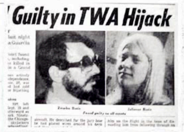
MEDIJI Jugoslavenski političari strahovali su da će suđenje Bušiću i otmičarima biti pretvoreno u medijski spektakl kojim bi se otvorilo hrvatsko pitanje u Sjedinjenim Američkim Državama