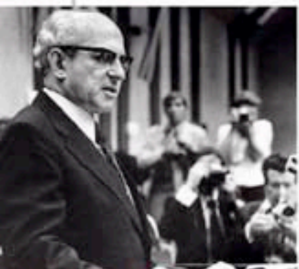
MILOŠ MINIĆ Srpski član Predsjedništva SFRJ vjerovao je u zavjeru SAD-a i Bušića

kontrolira čitavu tu stvar. Imamo točne informacije da se pripremaju leci koji treba da budu podijeljeni unutar same zgrade OUN od strane iste te grupe koja je pripremala ekciju zajedno s kidnaperima..." Mirić se, u nastavku izlaganja, upustio u zahtjevnije elaboriranje cijele stvari, nastojeći dati cjelovitiju političku analizu: - S ovim (mislio je na verbalnu diplomatsku notu - op. aut.) mislimo da pružimo podršku i jednoj grupaciji u State Departmentu koja je do sada vrlo uvjerljivo pokazivala tendenciju da razvija konstruktivnu suradnju s Jugoslavijom. Druga grupacija koja se grupira oko Kissingera (tadašnjega državnog tajnika SAD-a - op. aut.), kojoj pripada i ambasador SAD Silberman, ona je za politiku pritiska na Jugoslaviju. Ona je nama u razgovorima otvoreno rekla da mora postojati reciprocitet - ako mi ne vodimo računa o međunarodnim interesima SAD-a (Koreja, Panama, Portoriko itd.), onda ni oni neće voditi računa o našim interesima.